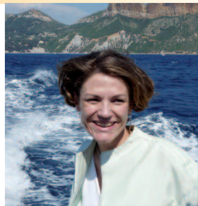
Chantal JOUANNO, secrétaire d'Etat chargée de l'Ecologie en visite le 26 juin 2009 sur le territoire de projet du Parc national des Calanques

Les travaux des «ateliers de la concertation» se poursuivront jusqu'à l'automne, en vue de proposer en fin d'année un premier projet de charte à l'assemblée générale du GIP. Il sera ensuite soumis à consultation locale auprès de