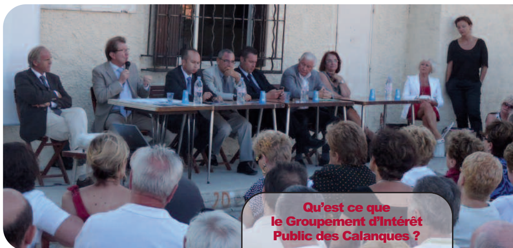
Réunion publique aux Goudes le 9 juillet 2009